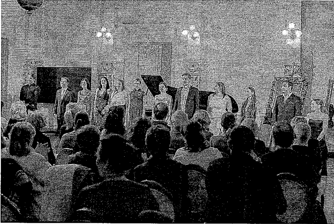
Стипендисти након успешног наступа на Концерту добитника стипендије Фонда за унапређење вокалне уметности младих „Меланије Бугариновић и ћерке Мирјане Калиновић-Калин“ у Новом Саду, Градска кућа, Нови Сад, 1. марта 2023. године

Концерт стипендиста је сниман, аудио и визуелно, а у ову активност су укључени студенти Академије уметности у Новом Саду. Снимци концерата Фонда су резултат добре сарадње Фонда и Академије уметности у Новом Саду, а сам материјал је веома значајан, како за саме стипендисте, тако и за архиву Фонда.