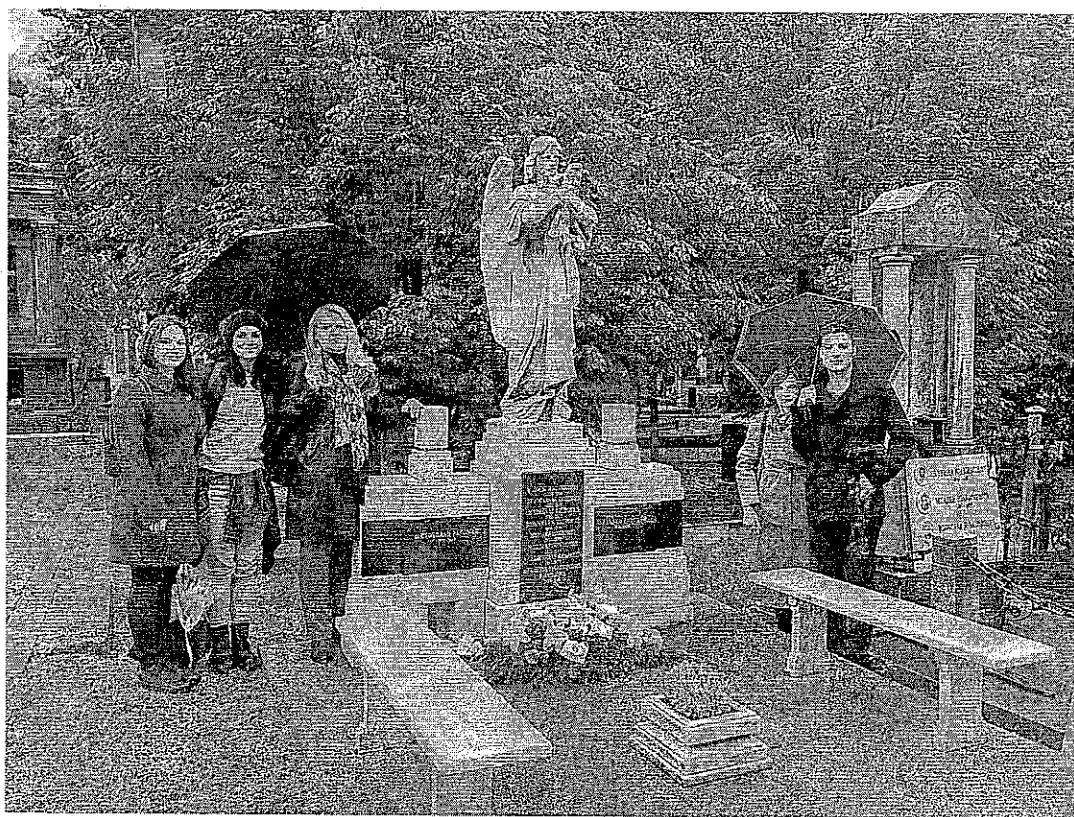
Обилазак гробнице Меланије Бугариновић на Новом гробљу у Београду, 8. маја 2023. године

Обиласком гробнице и полагањем цвећа на гроб чувене оперске певачице, Град Нови Сад и Фонд за унапређење вокалне уметности младих „Меланије Бугариновић и ћерке Мирјане Калиновић-Калин“ у Новом Саду доприносе неговању успомене на племенити гест Меланије Бугариновић, која је сву покретну и непокретну имовину поклонила Граду Новом Саду са циљем да се подстиче вокално стваралаштво младих у Новом Саду.